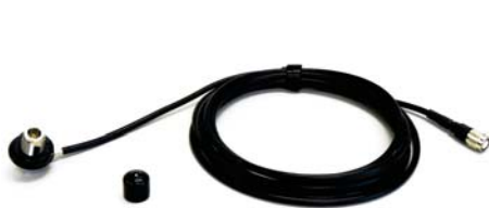
Fiksni nosilec ADN-21/N