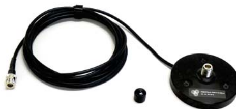
Magnetni nosilec ADM-21/N